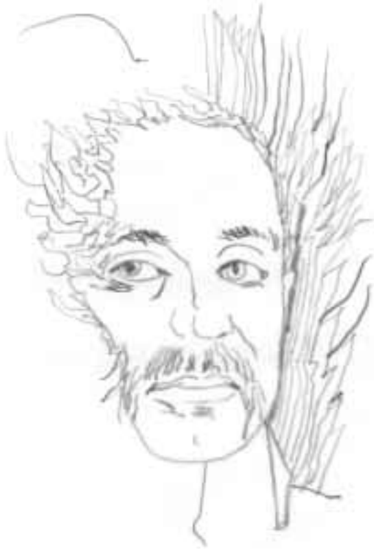
Rainer Maria Rilke von mir im August 2001 gezeichnet